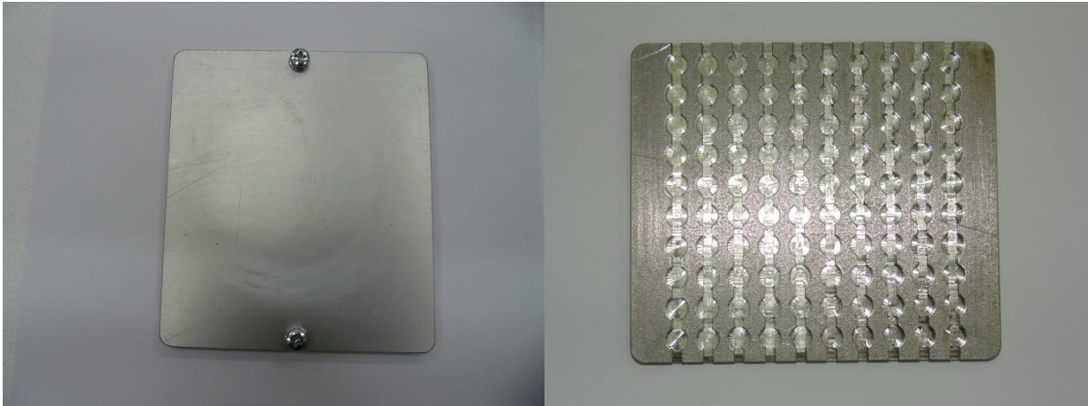
Рис.1 Алюминиевая кассета и стальная пластина (слева направо) для отжига

При периодической поверке системы методом «доза-почтой», после облучения дозиметров, отдел поверки НПП «Доза» возвращает Заказчику дозиметры (измерительные каналы) с фоновыми дозиметрами (2-3 дозиметра) без указания конкретных доз облучения в поверочных точках. Пользователь системы производит измерение показаний детекторов дозиметров, расчет доз облучения (на основе калибровочного коэффициента дозиметров данного типа из свидетельства о первичной поверке) и присылает в отдел поверки НПП «Доза» оформленный протокол измерений (Приложение 1) для их анализа.